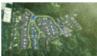
Distrito Regional de Inovação de Itajaí